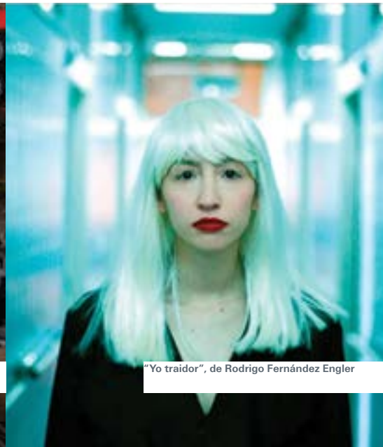
"Yo traidor", de Rodrigo Fernández Engler